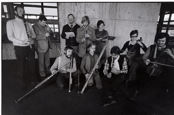
Das Ensemble im November 1975

Nach den beiden italienischen Konzerten kam es noch zu einigen Projekten in dieser Formation, bis sich die Wege im November 1975 trennten, weil ein Teil des Ensembles andere Interessen verfolgte.