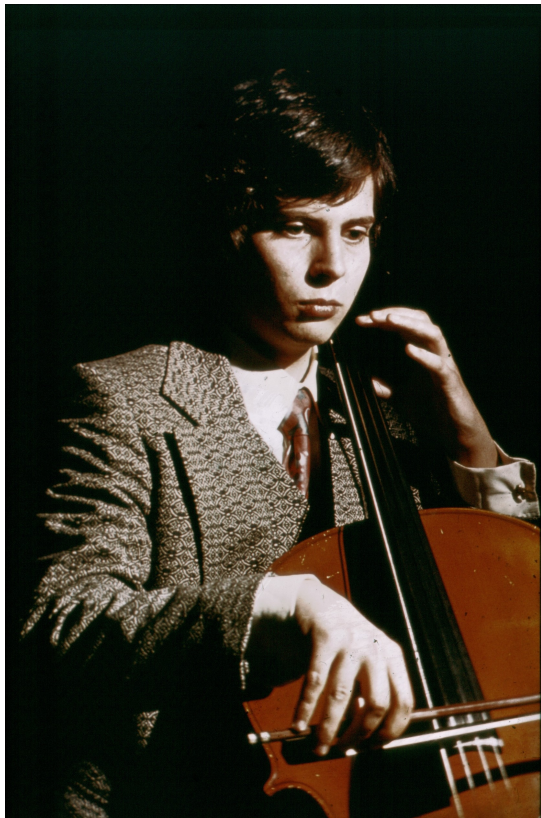
Basso Continuo bei Barockmusik, damals mit Anzug, Krawatte und sogar Manschettenknöpfen

Zu dieser Zeit gab es im Fernsehen eine Sendung „Musik aus Studio B“; das gab den Ausschlag zur Namensgebung.